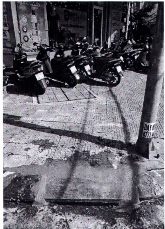
Hình ảnh trước sau xử lý trên vỉa hè ngã tư Nguyễn Chí Thanh – Phan Đình Phùng