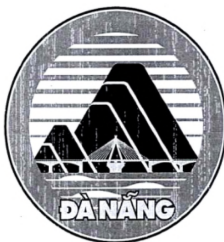
Hình 02. Mẫu Biểu tượng in đen trắng