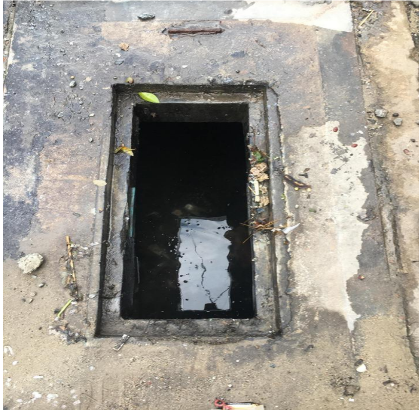
Hình ảnh trước xử lý tại hố ga trên đường Trần Nhật Duật