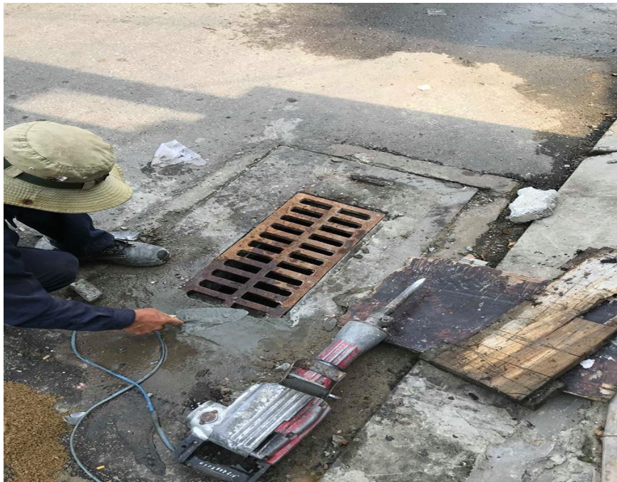
Hình ảnh sau xử lý tại hố ga trên đường Trần Nhật Duật