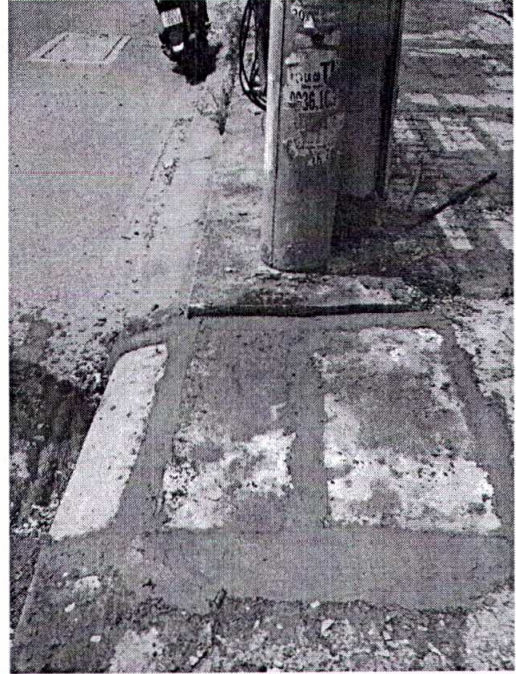
Hình ảnh trước và sau xử lý trên vỉa hè trước số nhà 147 Lê Trọng Tấn