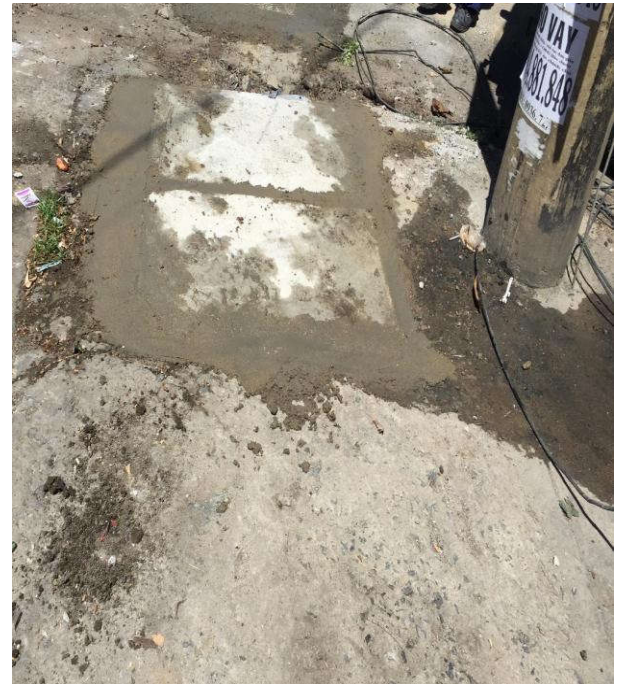
Hình ảnh khắc phục sự cố