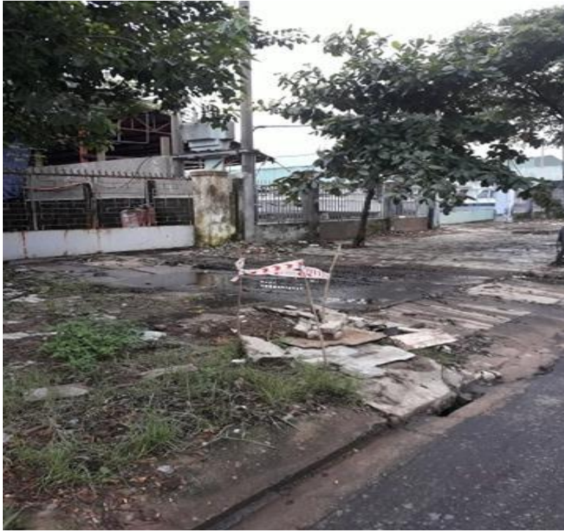
Hình ảnh trước xử lý tại hố ga không nắp trên đường Hồ Hán Thương