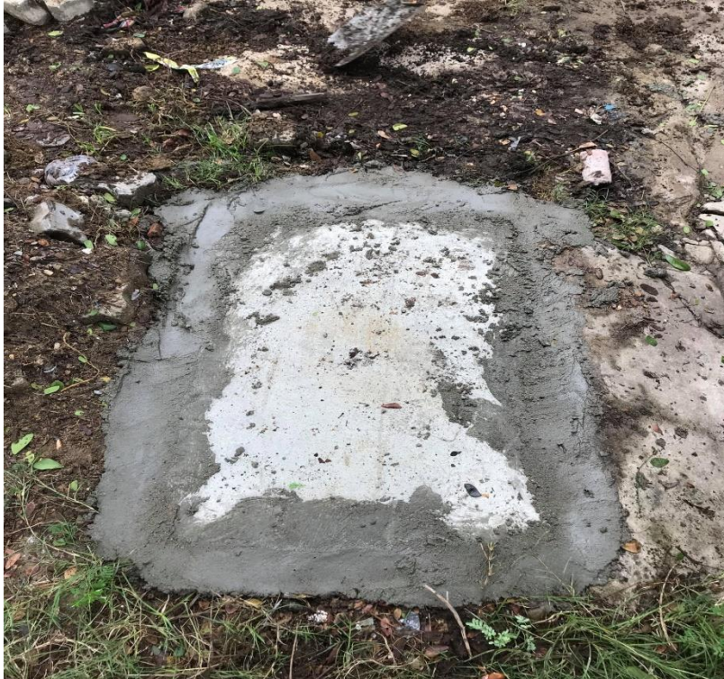
Hình ảnh sau xử lý tại hố ga không nắp trên đường Hồ Hán Thương